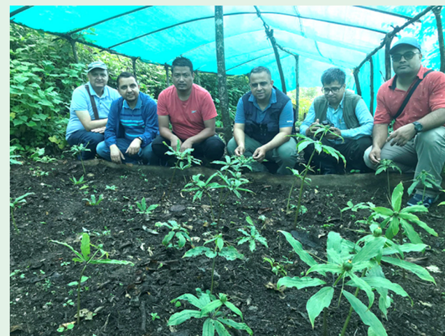
सतुवा खेती अनुगमनमा फोकल टिम सदस्यहरु