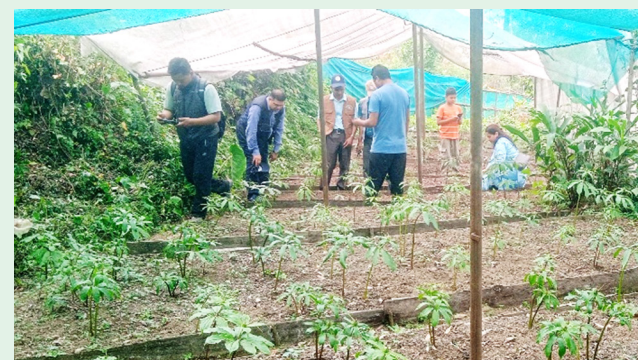
उद्योग पर्यटन वन तथा वातावरण मन्त्रालयका सचिवज्यू समेतबाट सतुवा खेती अनुगमन