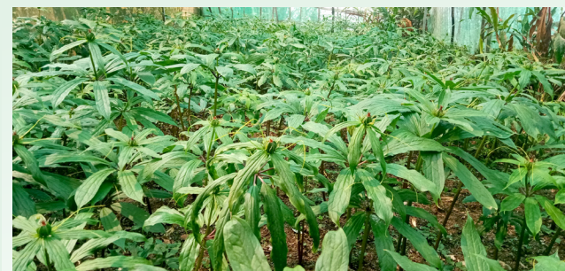
बीउ र गानोबाट उत्पादनको लागि तयार गरिएको सतुवा खेतीको नमुना स्थल (मर्स्याङ्दी गा.पा.-७, छिनखोला)